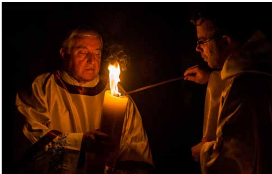
Utrinek z velikonočne vigilije.

In moj odgovor: »Bom.« Ne iz prepričanja, iz ponižnosti. Bom že zdržal. Med obveznostmi delavnika pozabim na dano obljubo in lažje zadiham. Velika noč pa se bliža in nemir v meni raste, še bolj pa strah.